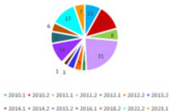
Turmas implantadas no Parfor/UFPI (2010 - 2023)

O nosso propósito é oferecer aos professores da educação básica pública uma formação sólida, referenciada e de qualidade nas diversas áreas do conhecimento. Nesse sentido, o engajamento de todos os envolvidos é fundamental para o sucesso do Programa.