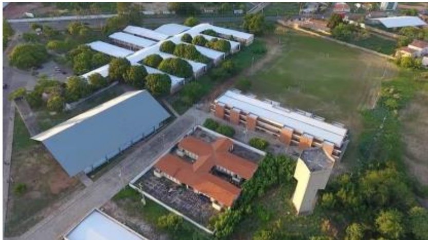
Figura 01. Vista aérea do Colégio Técnico de Floriano