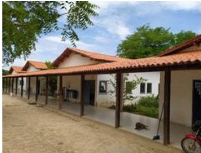
Figura 02. Setor de Agroindústria da Fazenda do Colégio Técnico de Floriano