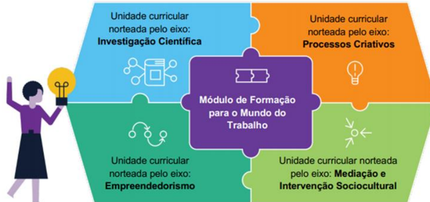
Figura 03. Eixos estruturantes

Fonte: CONSED: Frente Currículo Novo Ensino Médio/ Itinerários formativos