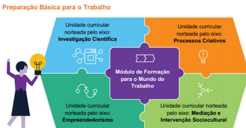
Figura 03 - Eixos estruturantes

O arranjo curricular do 5º itinerário formativo busca o desenvolvimento da Educação Técnica Profissional, articulada à formação para o mundo do trabalho organizada nos seguintes eixos estruturantes: