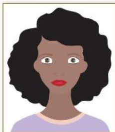
Figura 1. Modelo de Foto Frontal