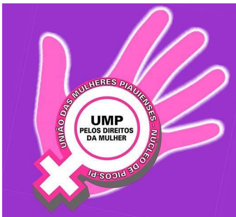
Imagem 02: Logotipo da UMP – núcleo Picos-PI

O movimento era muito discriminado justamente por tratar de todos esses tabus, contudo, essas atitudes formaram forças para que a luta não cessasse, o que fez com que permanecesse até os dias atuais, mais de três décadas depois. A união na cidade de Picos foi formada por mulheres que queriam lutar pelos seus direitos. Uma das grandes bandeiras do movimento é a autonomia, que continua até hoje.