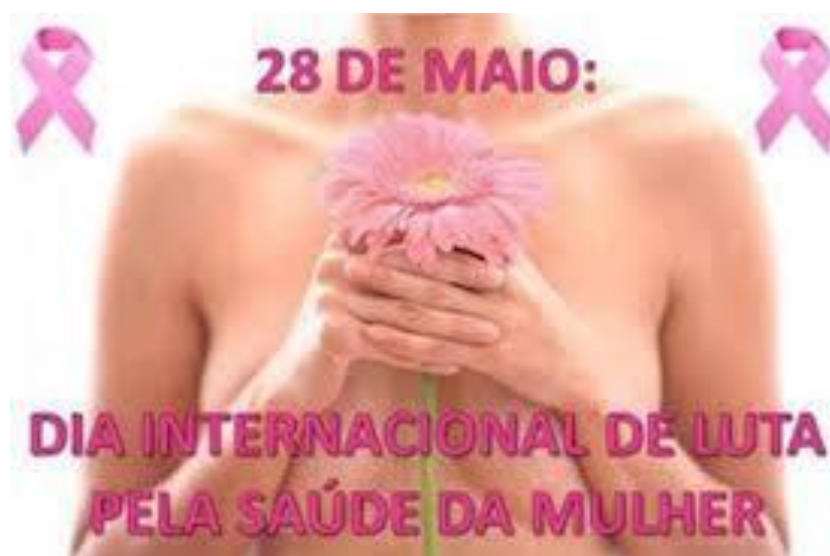
Imagem 12: Saúde da Mulher

A conscientização através das mídias sociais não são apenas sobre questões de violência, mas também à necessidade de cuidar da saúde.