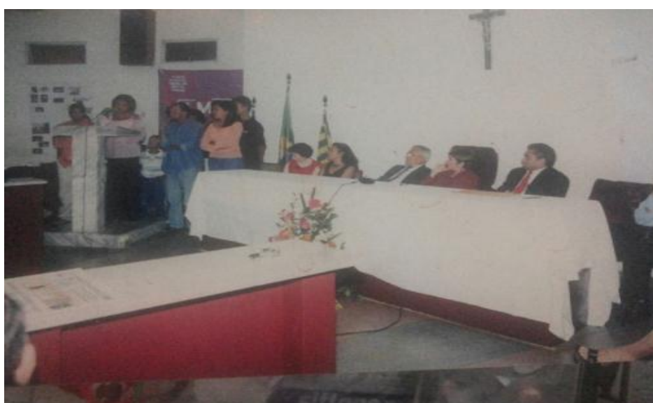
Imagem 01: Recebendo o título de cidadã picoense.

Aos poucos, os olhares de reprovação foram se ressignificando e dando lugar ao reconhecimento de uma vida de luta, ao que se percebe na fotografia abaixo: