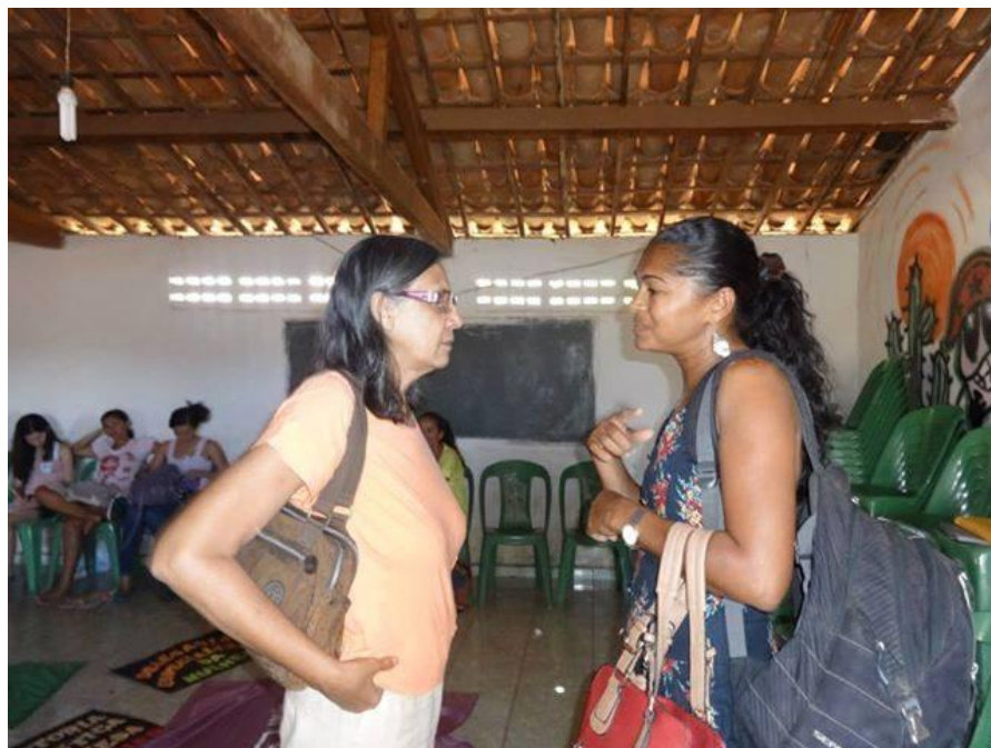
Imagem 10: Encontro de formação política com os jovens de Itainópolis, UMP e Recid.

A imagem abaixo, mostra esses intercâmbios com outros movimentos e outras cidades nessa cadeia de empoderamento feminino.