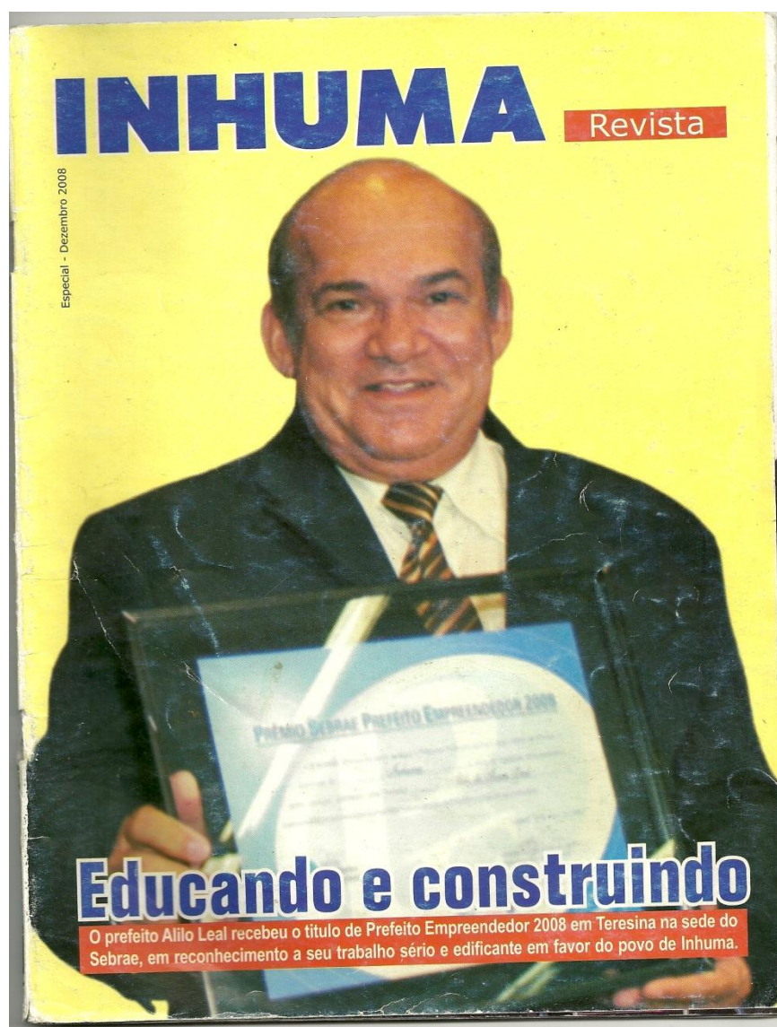
Figura 6. Revista Inhuma

Enfim, o gestor apresenta uma grande parte de suas ações enquanto administrador da cidade, que abrangem providências tomadas em vários campos: Educação, Cultura, Esportes, dentre outras. Esta revista, sobretudo, foi utilizada como forma de reforçar as ações do prefeito havendo, assim, uma tentativa de propagar, por parte do mesmo, o que considerava significativo. Das relevantes revistas das quais tivemos acesso 47 , todas falam das obras realizadas pelo prefeito e associam à sua imagem ao bom cumprimento dos seus deveres como representante do poder executivo municipal.