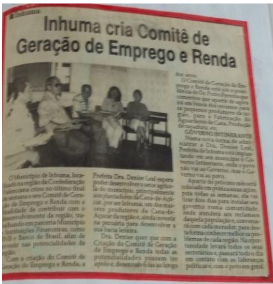
Figura 8: Inhuma Cria Comitê de Geração de Emprego e Renda

Como podemos avaliar em imagem abaixo de jornais da época.