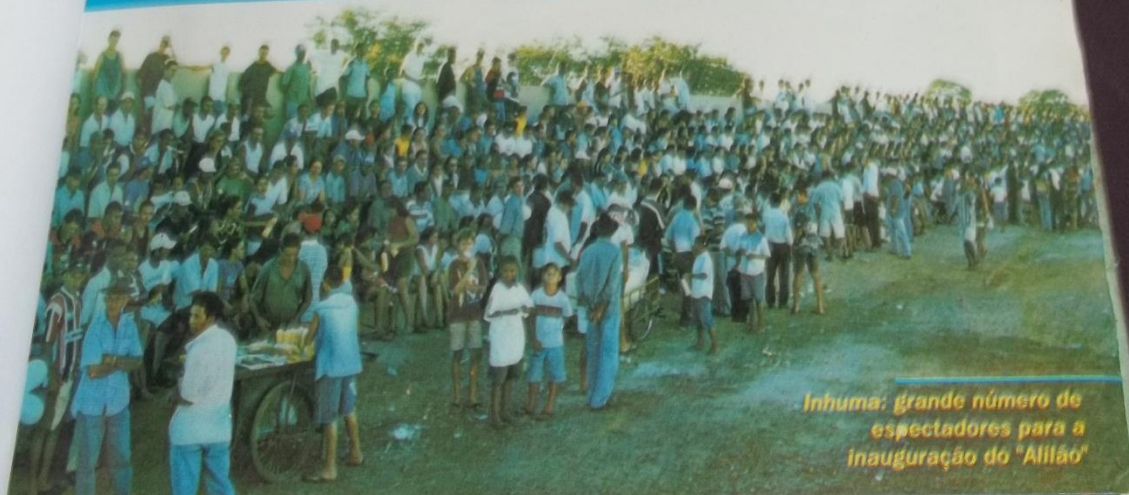
Inhuma: grande número de espectadores para a inauguração do "Alilão"