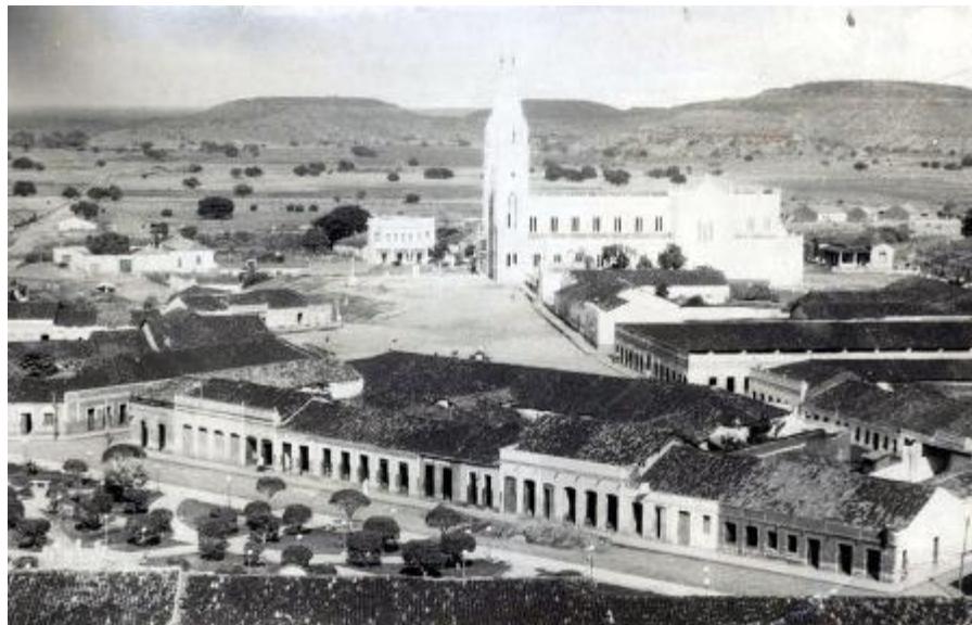
Figura 4: Vista parcial da cidade de Picos na década de 1950.

A construção da Igreja Matriz foi um marco para Picos, pois a cidade não dispunha de prédios com dimensões como a da mesma e, por ser uma cidade interiorana, é difícil compreender como a população angariou recursos financeiros para levantar a igreja em sua forma estrutural. Para Duarte, “A construção da Igreja Matriz, iniciada em 1948, marcou uma nova era em Picos, já que foi a primeira edificação de tamanha altura e expressividade na cidade, diferente de qualquer prédio da cidade de Picos na época, tanto em dimensão quanto em arquitetura”. 48