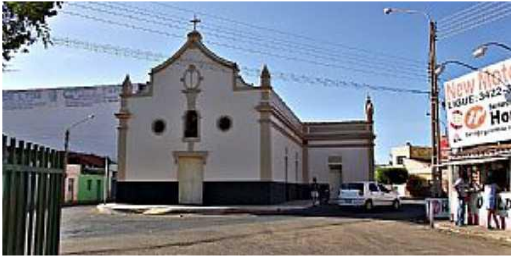
Figura 3: Igrejinha do Sagrado Coração de Jesus, circundada por casa e ruas.

Fonte: http://www.ferias.tur.br/thumbnail/5665/600/300/n_picos-pi-lateral-da-matriz-fotowluiz.jpg . Acesso em 22 de novembro de 2016.