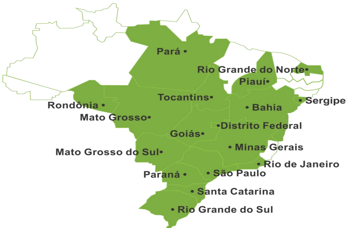
Figura 1- Distribuição dos Observatórios Sociais no Brasil