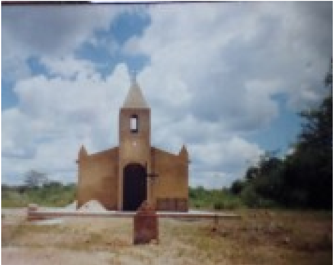
Imagem 5 – Igreja católica Nossa Senhora de Fátima