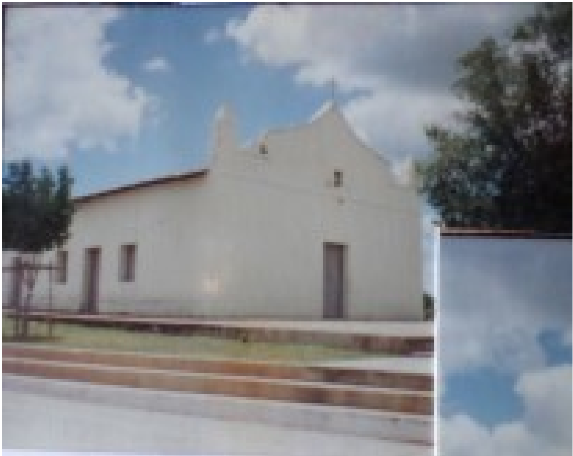
Imagem 4 – Igreja católica São Sebastião Fátima

Fonte: MOURA, Maria Ana de, LEAL Maria Rosário, Leal, Maria Rosenir. Sussuapara-PI, Sussuapara-PI, 2002, p.07.