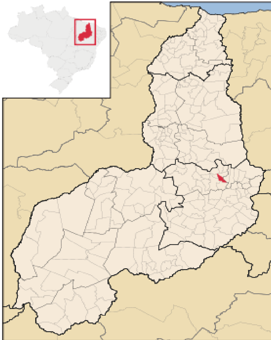
Figura 1 – Representação da cidade no estado do Piauí

O município de Sussuapara fica localizado na microrregião de Picos (Ver Figura 01), compreendendo uma área irregular de 208 km 2 , limitando-se ao Norte com: São José do Piauí e Bocaina; ao Sul: Picos e Geminiano; ao Leste: Santo Antônio de Lisboa e Bocaina; a Oeste: Picos e Santana do Piauí. Segundo dados do IBGE (2015), a cidade de Sussuapara contava, até o ano em questão, com 6.235 habitantes.