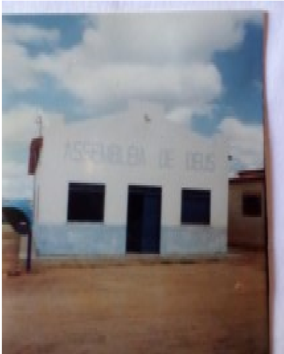
Imagem 6 - Templo da Igreja Assembleia de Deus.

Fonte: MOURA, Maria Ana de, LEAL Maria Rosário, Leal, Maria Rosenir. Sussuapara-PI , Sussuapara-PI, 2002, p. 08