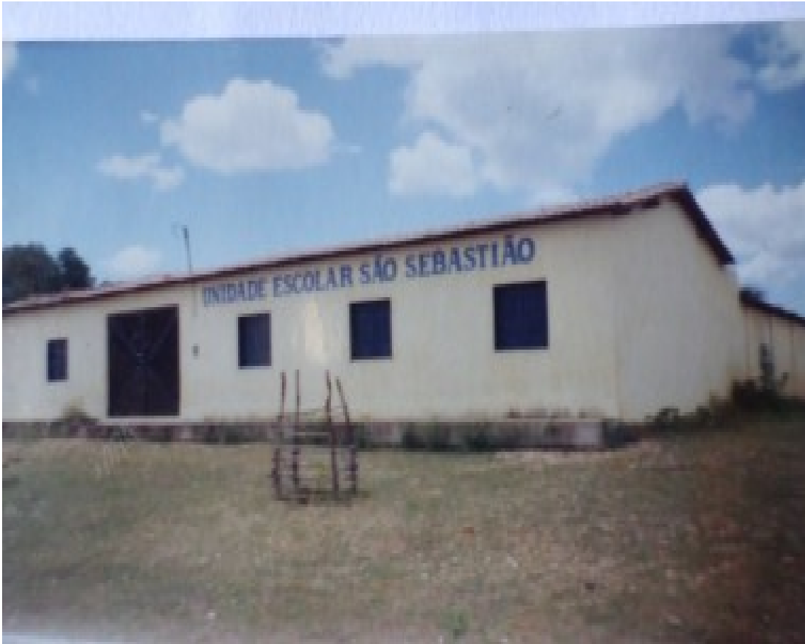
Figura 2 – Unidade Escolar São Sebastião