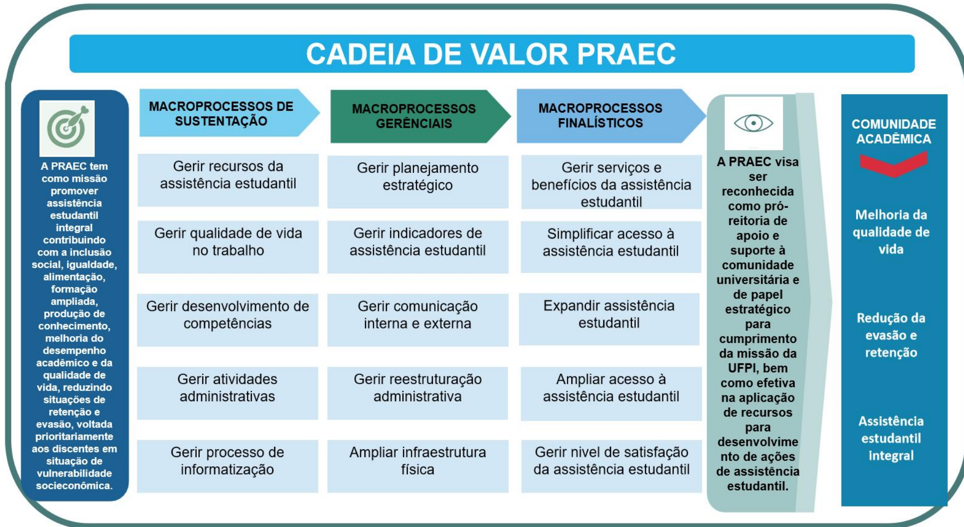
Figura 4 – Cadeia de Valor a Pró-reitoria de Assuntos Estudantis e Comunitários.