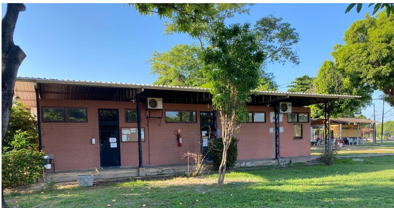
Figura 2 – Fachada da PRAEC.

A PRAEC fica localizada no Campus Ministro Petrônio Portela (CMPP), em Teresina (Figura 1) próximo ao Centro de Ciências da Natureza (CCN) e ao Centro de Ciências da Saúde (CCS). A sua administração fica localizada nos blocos 01, enquanto a CACOM fica localizada nos blocos 02 e 03.