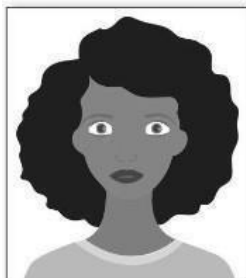
Figura 1. Modelo de Foto Frontal