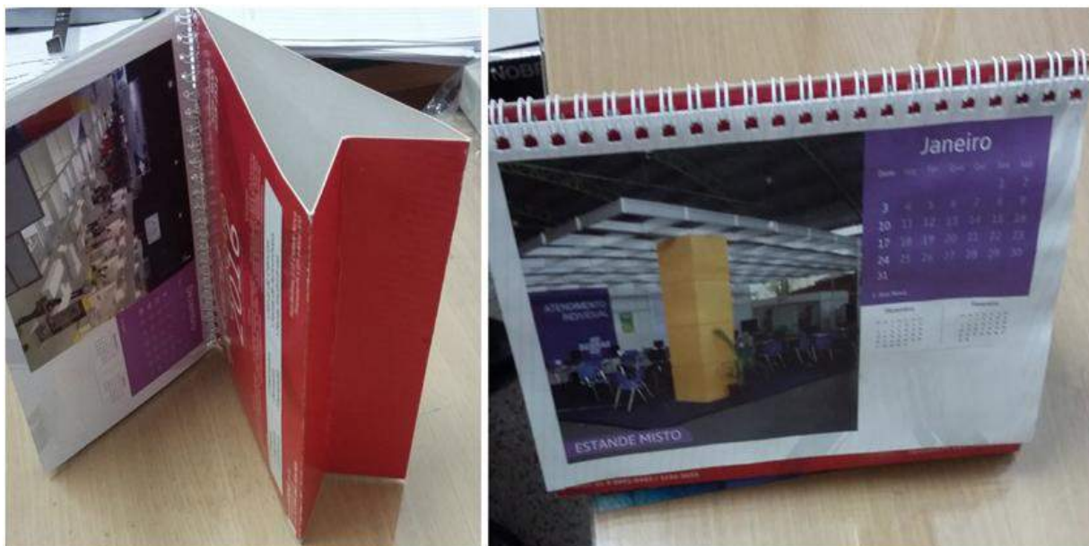
[Lote 01 – Item 01]