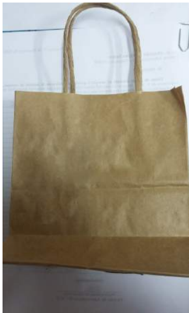
[Lote 04 – Itens 01, 02 e 03]