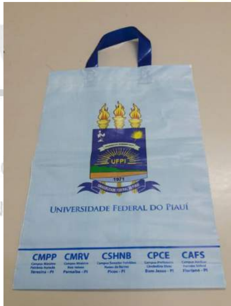
[Lote 08 – Itens 01, 02 e 03]