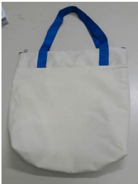
[Lote 06 – Item 01]