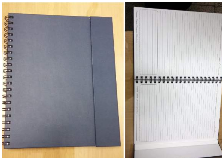
[Lote 03 – Item 01 e 02]