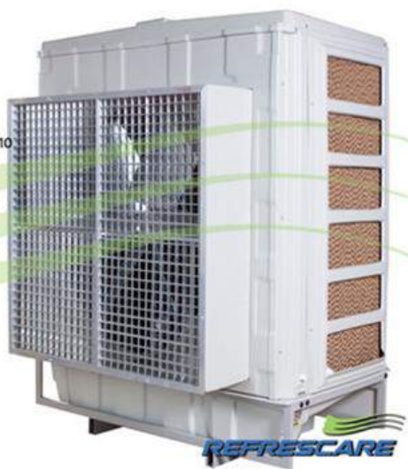
Lote 09 – Item 02

Vazão: 42.000 m 3 /h Voltagem: 220V@60Hz Consumo: 1,2 kW/h Corrente: 7,2 A Max Nível de Ruído: <65 DbA Cobertura: 250 m 2 a 600 m 2 Certificado: SIM Dimensões (mm): 1550 x 2030 x 1210 Peso: 128 kg