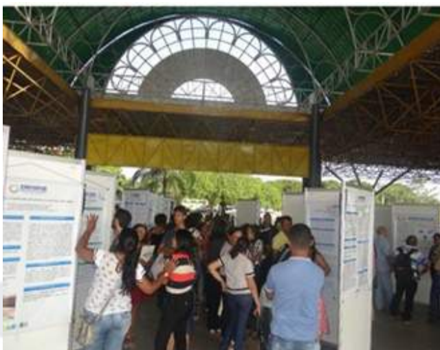
Lote 09 – Item 01

Vazão: 42.000 m 3 /h Voltagem: 220V@60Hz Consumo: 1,2 kW/h Corrente: 7,2 A Max Nível de Ruído: <65 DbA Cobertura: 250 m 2 a 600 m 2 Certificado: SIM Dimensões (mm): 1550 x 2030 x 1210 Peso: 128 kg