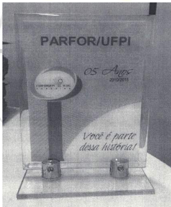
[Lote 05 – Item 01]