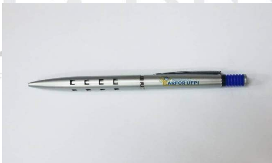
[Lote 02 – Item 01]