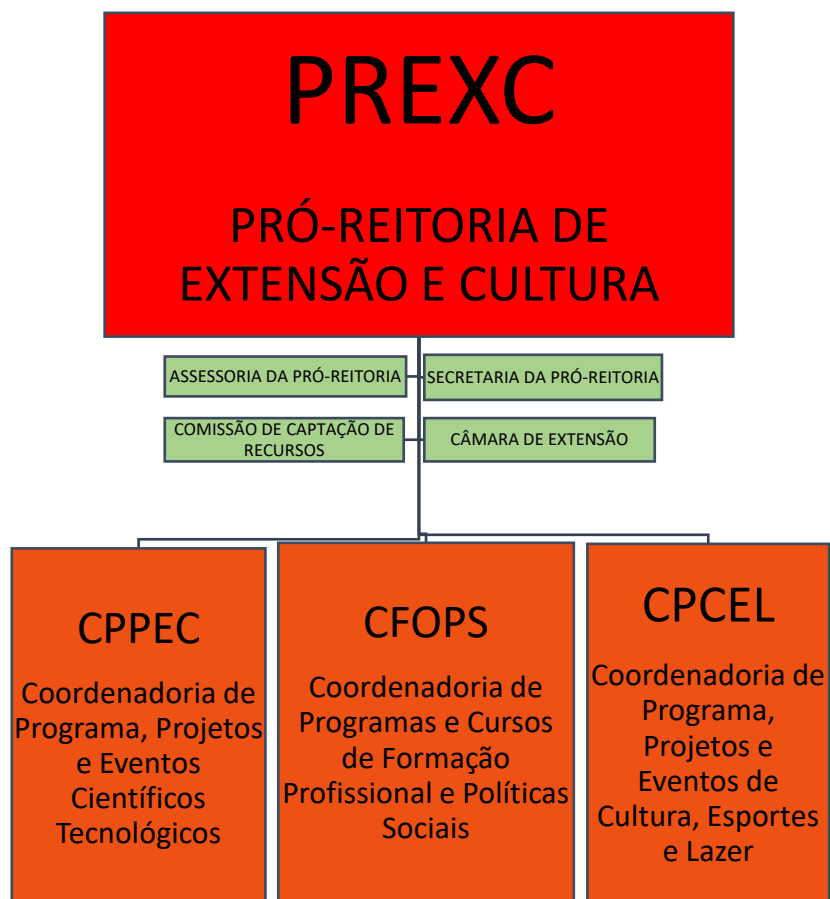
Figura 3: Estrutura organizacional da PREXC