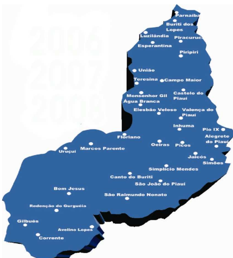
Figura 1- Localização geográfica dos Polos de Apoio Presencial da UFPI. Teresina, 2011

Participando do Projeto Universidade Aberta do Brasil (UAB), criado pelo Ministério da Educação, em 2005, no âmbito do Fórum das Estatais pela Educação, para a articulação e integração de um sistema nacional de educação superior à distância gratuita e de qualidade, em caráter experimental, foi implantada a UAPI com vistas a sistematizar as ações, programas, projetos, atividades pertencentes às políticas públicas voltadas para a ampliação e interiorização da oferta do ensino superior gratuito e de qualidade no Brasil. Atualmente são ministrados 10 cursos na modalidade EaD, em 31 pólos de apoio presencial, distribuídos em todas as microrregiões homogêneas do Estado, conforme mostra a Figura 1.